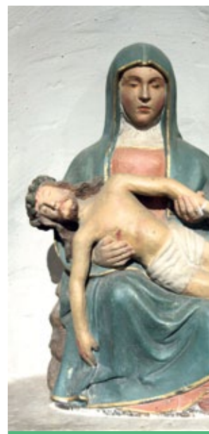
Piéta en pierre du XVI ème classée