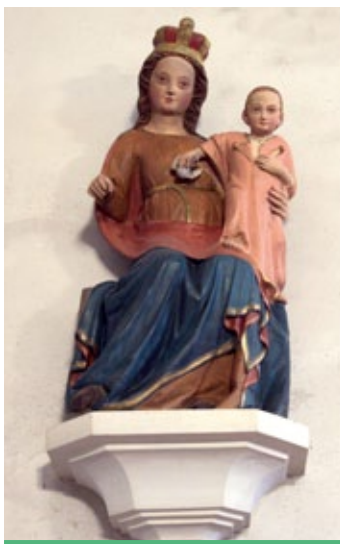
Notre-Dame de Montfort Ex-voto Bois du XIV ème et polychromie du XIX ème

Le mobilier, riche et diversifié, se compose d'un ensemble de statues, tableaux et retables.