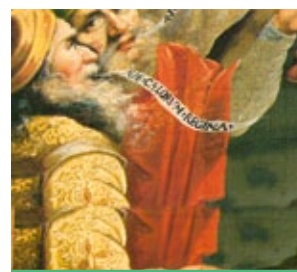
Détail de la naissance de la Vierge. Toile du XVI ème classée.