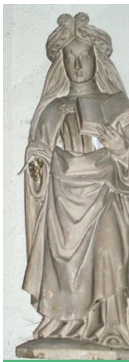
Sainte Marthe, bois peint 2 ème moitié du XV ème classée.