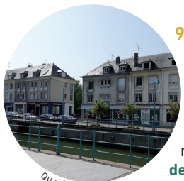
Quai Robert Leblanc