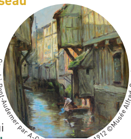
Canel à Pont-Audemer par A.-G. Voisard Margerie 1912