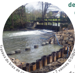
Travaux du bras de contournement des 7 vannes

Depuis longtemps, les acteurs locaux s'engagent dans le défi du rétablissement de la continuité écologique de la Risle, notamment par l'aménagement d'ouvrages comme celui des « 7 vannes ». La continuité écologique consiste à assurer la libre circulation des poissons et un bon transit sédimentaire dans nos cours d'eau par l'équipement, l'aménagement, l'effacement des ouvrages bloquants. Ainsi la Risle, premier affluent de la Seine, est une rivière au potentiel migrateur très fort (truite de mer, saumon atlantique, lamproies...). Par ailleurs, la ville de Pont-Audemer a obtenu en 2018 le label RAMSAR pour la conservation et la gestion durable de ses zones humides.