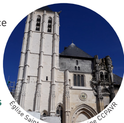
Église Saint-Ouen

Érigé entre le XI e et le XVI e siècle cet édifice demeure inachevé et a fait l'objet d'un important programme de restauration de 2015 à 2019. Remarquable exemple de l'architecture gothique normande, cette église majestueuse abrite également un ensemble de vitraux unique, dont les plus anciens datent du XVI e siècle.