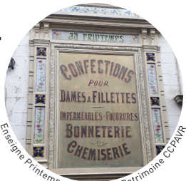
Enseigne Printemps restaurée

Située au-dessus du bras sud de la Risle, cette enseigne de style Art Nouveau date de la fin du XIX e ou du début du XX e siècle. Elle est le dernier symbole du magasin qui existait autrefois à Pont-Audemer aux n°16 et 18 de la rue Thiers et où les habitants de la ville sont venus s'habiller jusqu'au milieu des années 2000.