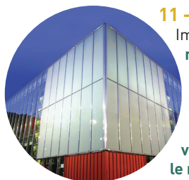
Théâtre de l'éclat