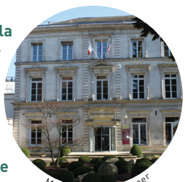
Mairie de Pont-Audemer

Autrefois l'hôtel de ville se situait rue de la République, face au musée Canel. Après-guerre, la mairie déménage dans les anciens locaux de la Banque de France, construits en 1860. Les bâtiments en brique situés le long de la Risle abritent également des services municipaux. Jusqu'en 1973 ils étaient le siège d'une fromagerie industrielle importante : la fromagerie Dinkla.