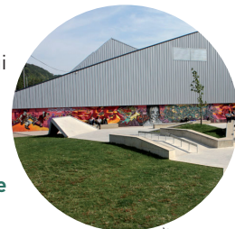
Le Skate Park

Avant de profiter pleinement de la nature qui s'épanouit aux portes de la ville, un dernier débarquement permet de découvrir le Skate Park réalisé par l'architecte Stéphane Flandrin en 2013. Cet élément incontournable de la culture urbaine longe la toute nouvelle voie douce qui se déroule le long de la Risle.