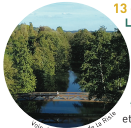
Voie douce le long de la Risle