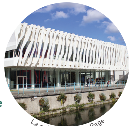
La médiathèque La Page

Ce bâtiment «basse-consommation» possède des formes remarquables conçues par les architectes Geoffroy & Zonca. On y trouve des salles de lecture, des espaces numériques, des patios, un hall d'exposition ainsi qu'un jardin de lecture sur les toits.