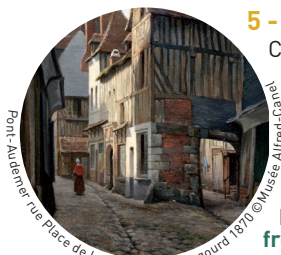
Pont-Audemer rue Place de la Ville par A. Bougourd 1870

Cette rue figure parmi les plus anciennes rues de Pont-Audemer. On peut y admirer une belle succession de maisons datant du XVI e au XVIII e siècle. Celles situées aux n°16 et 18 sont inscrites aux Monuments Historiques. On y trouvait autrefois l'Hôtel de Ville et périodiquement s'y tenait le marché aux fromages.