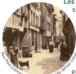
Rue Paul Clémencin fin XIXe

Les habitations qui longent cette rue n'ont pas subi le même alignement que dans les rues avoisinantes (rue Sadi Carnot et rue de la République). Ces décrochements ajoutent au charme et à l'ambiance médiévale que l'on peut ressentir en s'y promenant. Paul Clémencin alias David est un résistant normand fusillé par les Allemands au Mont-Désert (commune de Tourville-sur-Pont-Audemer) le 14 juillet 1944. Avant cette hommage, cette rue, tout comme le canal qu'elle enjambe, s'appelait rue aux Pâtisseries.